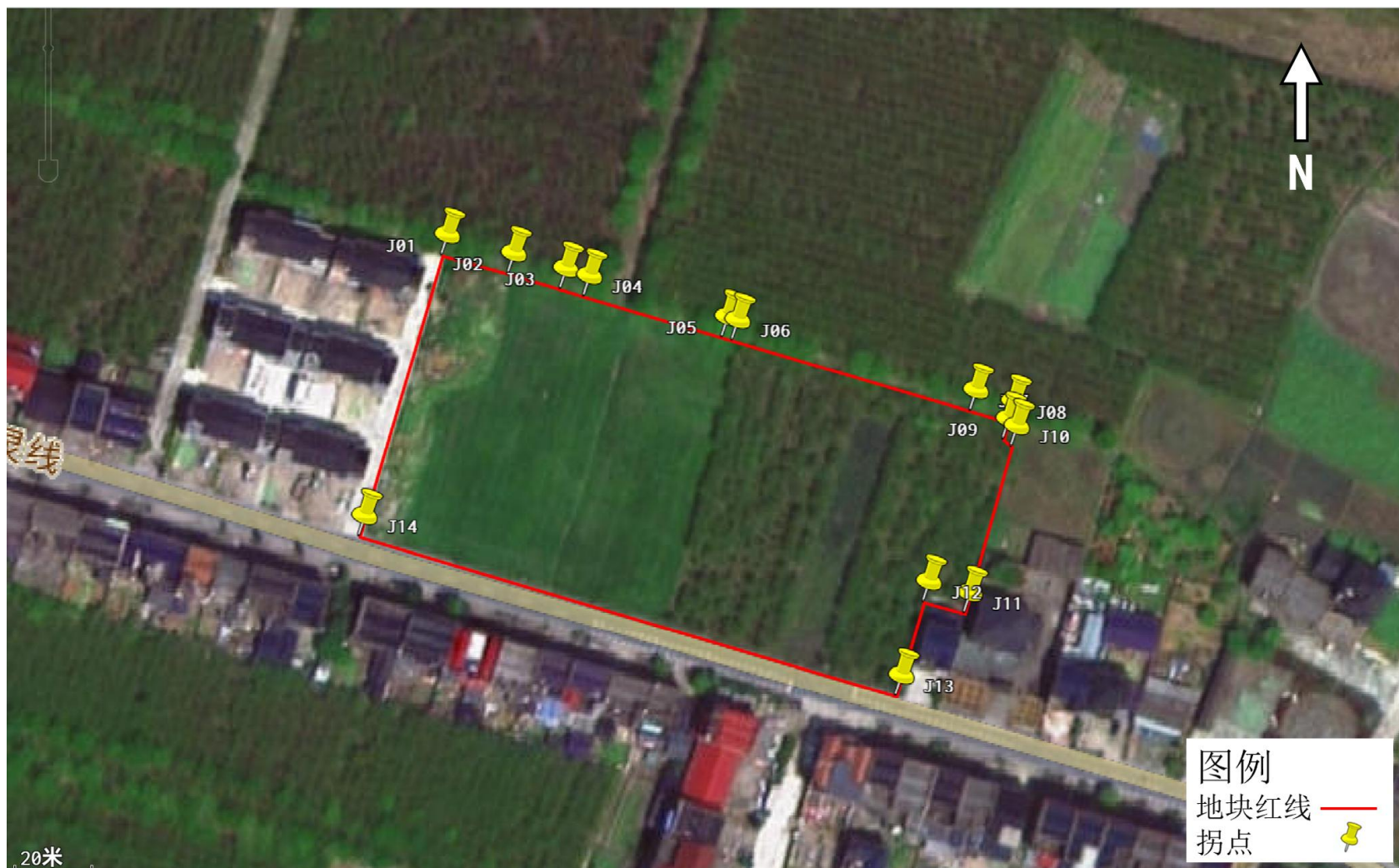
图 2.2-2 调查地块拐点图